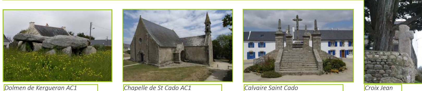
Dolmen de Kergueran AC1 | Chapelle de St Cado AC1 | Calvaire Saint Cado | Croix Jean