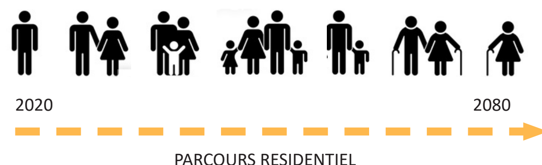
EVOLUTION DE LA POPULATION